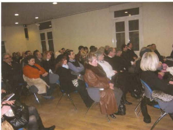
&gt;&gt; Αποψη του ακροατηρίου της εκδήλωσης

σθοδρόμησης. Δεν αμφισβητεί βεβαίως ο συγγραφέας την απίστευτη συσσώρευση γνώσεων σε όλους τους τομείς του επιστητού. Ορθότατα όμως επισημαίνει την απώλεια της “σοφίας” που κυριολεκτικά χάθηκε μέσα στον όγκο των γνώσεων. Εξάλλου αυτές ακριβώς οι γνώσεις ήταν που χρησιμοποιήθηκαν για την εξόντωση των ανθρώπων, την καταστροφή του περιβάλλοντος, την μόλυνση των νερών και του αέρα.